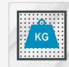
Revêtement passage intensif