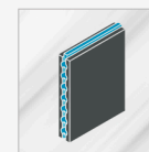
Panneaux sandwich laine de roche