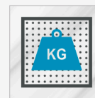
Revêtement passage intensif